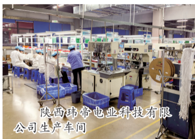
陕西玮帝电业科技有限公司生产车间

招商引资是经济增长的“源头活水”,是高质量发展的“新动能”。近年来,山阳县高度重视招商引资工作,充分发挥招商企业和商会载体作用,积极凝聚招商合力,成功招引到多家企业落户山阳,不断为当地经济社会高质量发展注入新动能。