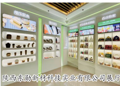
陕西东勋新材科技实业有限公司展厅

在项目实施过程中,商洛高新区简化项目审批流程,提供高效服务机制,为项目推进营造了良好的发展环境。目前,项目已完成全部建设内容和计划投资,并顺利通过竣工验收。