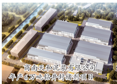
商南天和泥浆有限公司年产6万吨钻井封堵剂项目

“当初选择回乡创业,主要出于对家乡的深厚情感。在外打拼多年,始终心系家乡,希望能为家乡的发展贡献一份力量。同时,看到了家乡的潜力和机遇。商南有着丰富的资源和良好的发展前景,我坚信在这里可