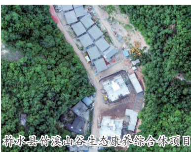
柞水县竹溪山谷生态康养综合项目

1998年,商南县赵川镇的任政府离开家乡外出闯荡,经过多次试错和多年拼搏,于2007年创办东莞通天下橡胶有限公司,从一名“粤漂”个体户成为一位企业负责人。尽管在外打拼多年,他却从未忘记哺育过他