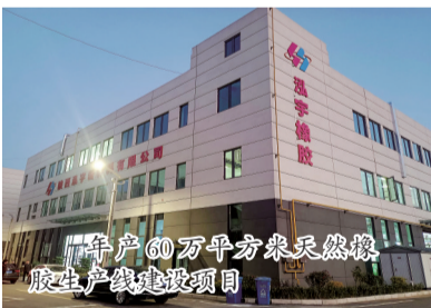
年产60万平方米天然橡胶生产线建设项目

1998年,商南县赵川镇的任政府离开家乡外出闯荡,经过多次试错和多年拼搏,于2007年创办东莞通天下橡胶有限公司,从一名“粤漂”个体户成为一位企业负责人。尽管在外打拼多年,他却从未忘记哺育过他