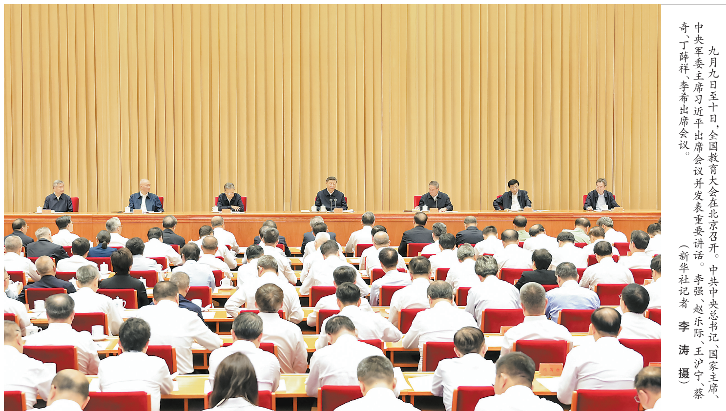
九月九日至十日，全国教育大会在北京召开。中共中央总书记、国家主席、中央军委主席习近平出席会议并发表重要讲话。李强、赵乐际、王沪宁、蔡奇、丁薛祥、李希出席。

新华社北京9月10日电 全国教育大会9日至10日在北京召开。中共中央总书记、国家主席、中央军委主席习近平出席会议并发表重要讲话。他强调，建成教育强国是近代以来中华民族梦寐以求的美好愿望，是实现以中国式现代化全面推进强国建设、民族复兴伟业的先导任务、坚实基础、战略支撑，必须朝着既定目标扎实迈进。